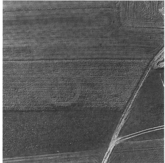
Fig. 8. Bonfol JU, Moncevi. Tumulus(?).

Im Westbereich der Ausgrabungsfläche konnten Sied- lungsreste des sog. Taminserhorizontes Ha D freigelegt werden. Es handelte sich hierbei um Steinzüge von be- trächtlicher Länge (z.T. bis 7.50 m und mehr), die teilwei- se V-förmig im Erdreich eingetieft waren. Die Steinzüge dienten wohl als Subkonstruktion für Holzbauten. Ähnli- che Steinzüge aus gleicher Zeit fanden sich auch auf dem unmittelbar benachbarten Areal des Markthallenplatzes, aber auch auf dem Karlihof östlich der Plessur.