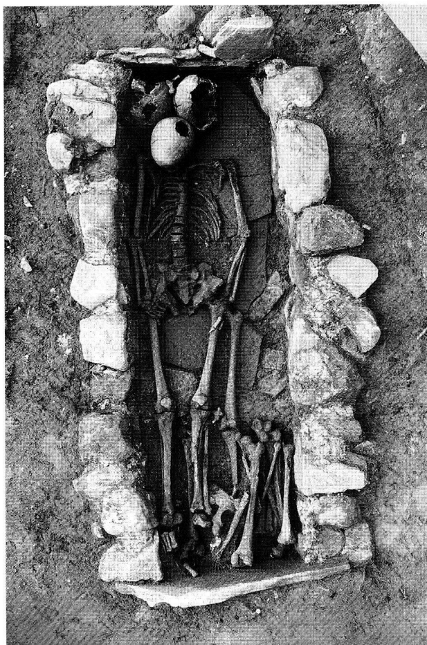
Fig. 40. Pully VD, chemin Davel 16. Tombe à murets maçonnés T44.

SAC FR, G. Bourgarel, P. Jatton et P. Cogné.