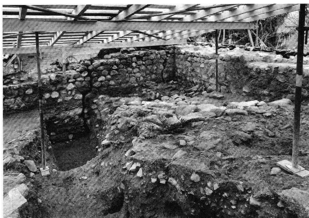
Abb. 38. Gams SG, Burg. Blick in die Südostecke des Burghofes. Gut sichtbar die zwei durchgehenden Risse in der Ostmauer.

ritaine, ce bâtiment est agrandi en direction de l'est, dans l'espace vide donnant sur la Sarine. Cet immeuble ne semble pas avoir été réuni aux autres avant le 16 e s., lors du couvrement de sa cave et de la reconstruction de la façade sur rue à l'emplacement actuel. Enfin, signalons la découverte d'un plafond peint du 16 e ou 17 e s. au sud du premier étage.