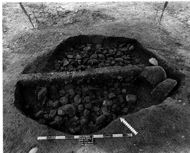
Abb. 9. Volketswil ZH, In der Höh. Brandgrube mit Hitzesteinen, frühe Spätbronzezeit (Bz D).

Datierung: archäologisch. Vermutlich Mittelbronzezeit. KA ZG, J. Weiss.