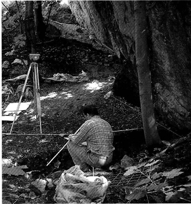
Fig. 7. Salgesch VS, Mörderstein. Vue des sondages en cours de fouille sur le flanc nord du rocher.

Faunistisches Material: wenig, unbearbeitet.