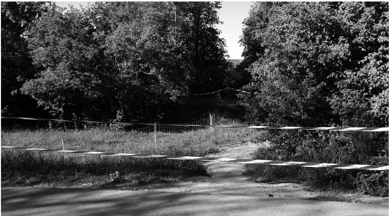
Abb. 3: Ein rot-weisses Absperrband als Symbol einer systemischen Grenze, die territorial verortet ist. An der grünen Ländergrenze westlich von Konstanz während des ersten Lockdowns.

Sollte man auch nicht ex nihilo argumentieren, so verwundert es dennoch nicht, dass die Binnengrenze zwischen Germania Superior und Raetia , die durch die Schweiz verläuft, kaum Bedarf an Markierung hatte. Wechselte zwar die Aussenform der germanischen Provinz wiederholt, wirkt das