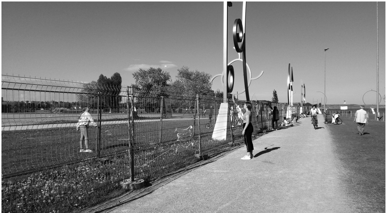
Abb. 2: Doppelter Grenzzaun an der schweizerisch-deutschen Grenze zwischen Konstanz und Kreuzlingen während des ersten Lockdowns 2020.