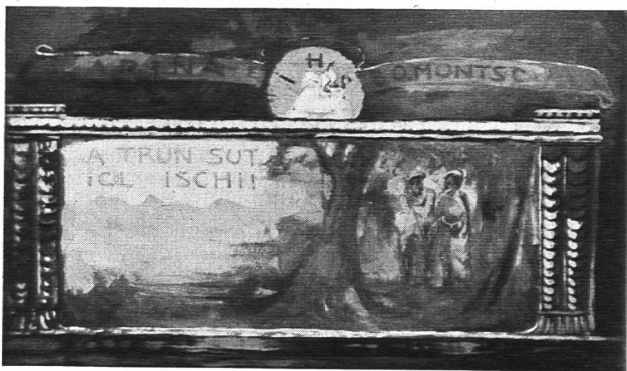
Wandfries im Pestalozzianum „Die romanische Schule“ von Edgar Vital