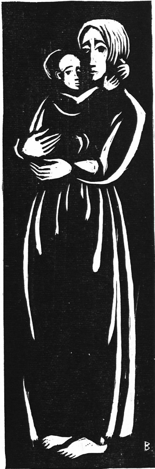
Mutter mit Kind B. B., 6 S., Holzschnitt