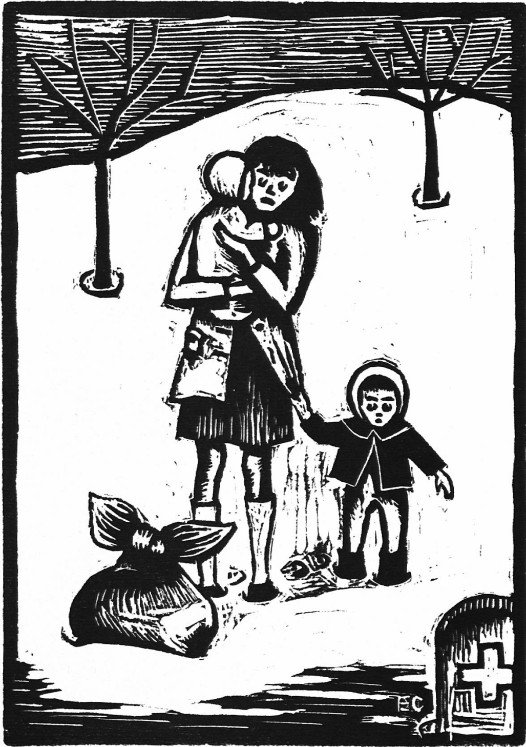
Flüchtlingskinder an der Grenze