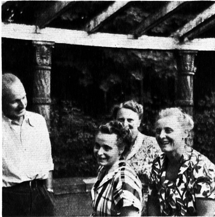
Lehrkräfte des Hauses Schwalbach

machte uns große Schwierigkeiten, so schön auch die Melodien waren. Am schnellsten ging es mit dem Kanon des Amerikaners: «Row, row, row your boat...» und mit Dr. Grobs «Tannigen Hosen».