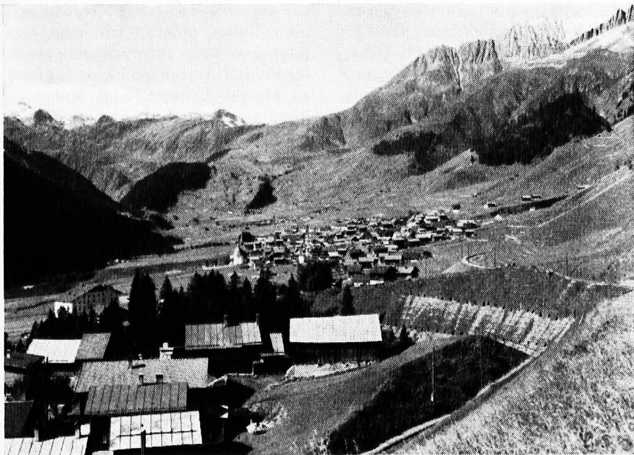
Vordergrund: Bugnei. Mitte: Sedrun, weiter hinten Camischolas. Oben rechts: Crispalt, Mitte Oberalppass und links Piz Badus

c) Metamorphe oder Umwandlungsgesteine, die durch grossen Druck und durch hohe Hitze aus den schon bestehenden geworden sind.