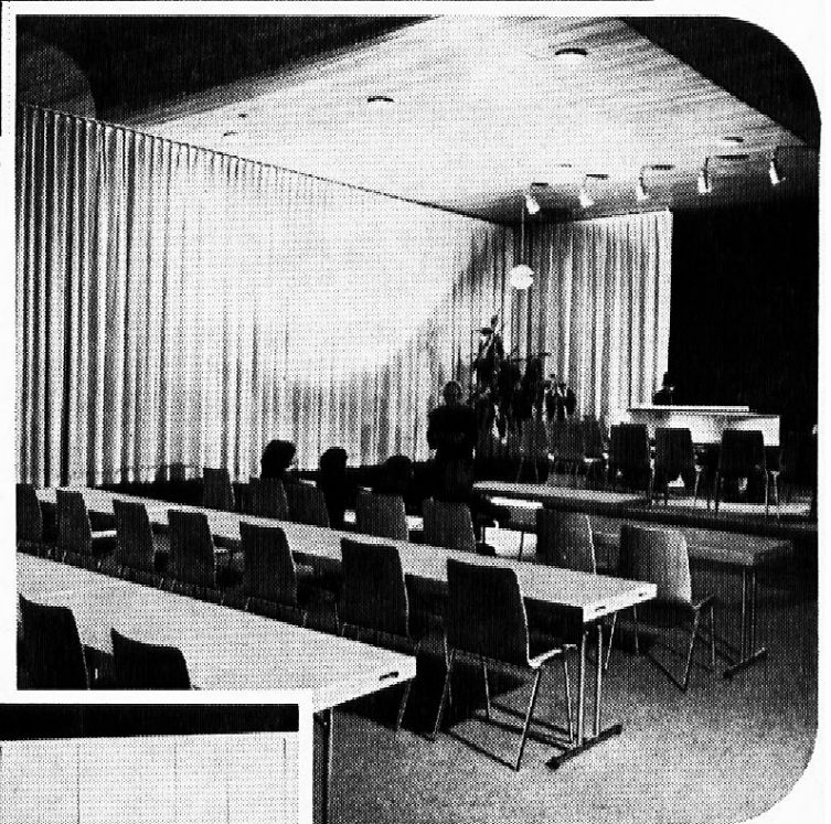
Saalmöbel für jeden Bedarf

Verlangen Sie unverbindlich Prospekte, Angebot und Möbliervorschläge.