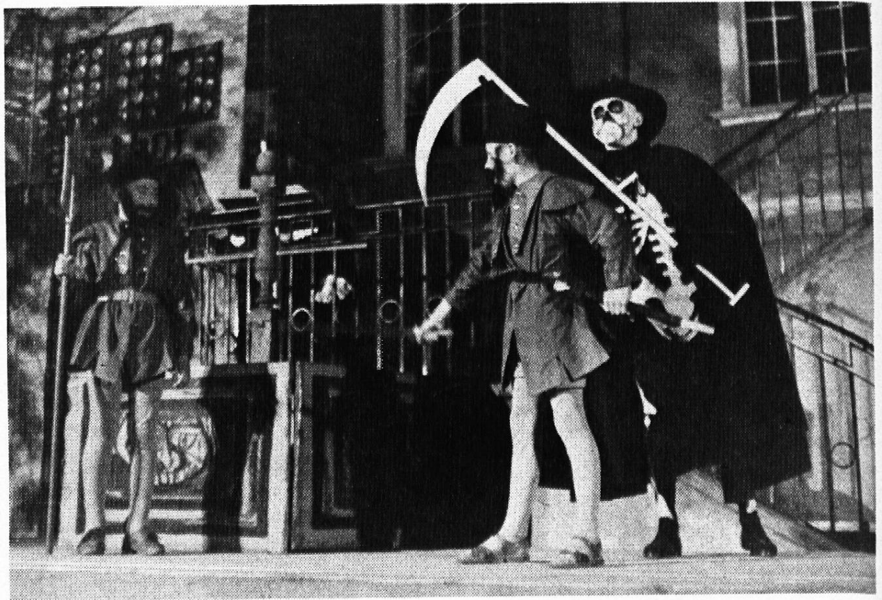
Szene aus dem Nicolai-Festspiel