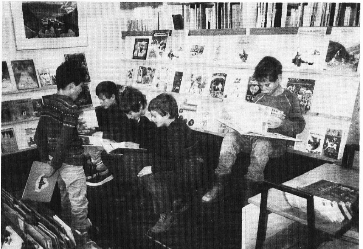
Nicht alle finden gleich das richtige Buch.

Einführung in die vollständige kleine DK