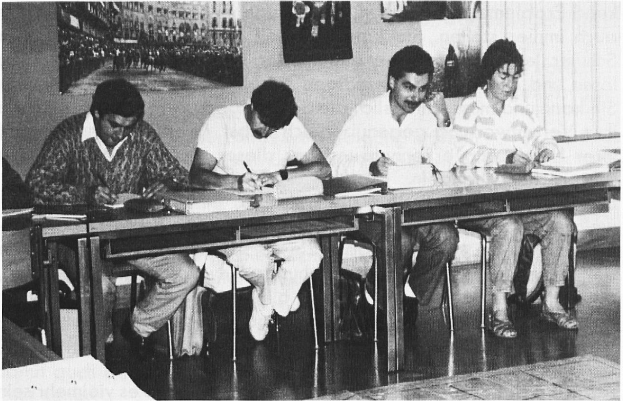
Bündner Lehrer an einem Weiterbildungskurs.

Erziehungsdepartement organisierten freiwilligen Kursen beteiligten und wenn im vergangenen Sommer über 500 Lehrer an den 24 Sommer-Fortbildungskursen in Chur teilnahmen.