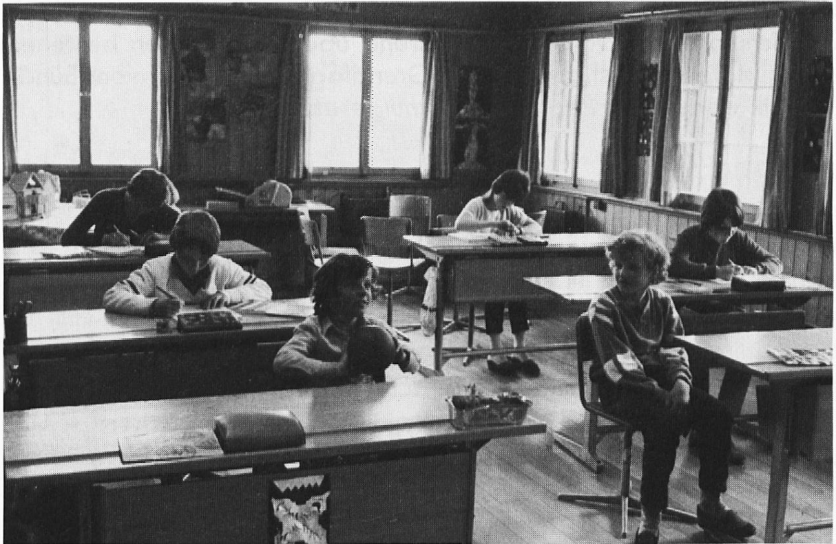
Heimelige Atmosphäre im Zimmer der Bergschule.

1000 Schülern oder von 23% pro Jahr. Die Gesamtzahl der Volksschüler ist innerhalb der gleichen Zeitspanne von 23 344 im Schuljahr 1974/75 auf 17 793 im Schuljahr 1986/87 um 6551 Schüler oder um 27% gesunken.