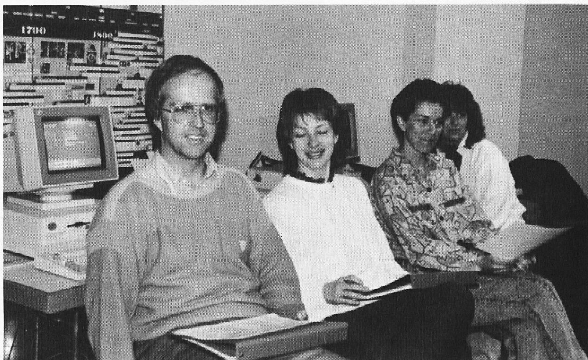
Informatik-Kurs in Mittelbünden.