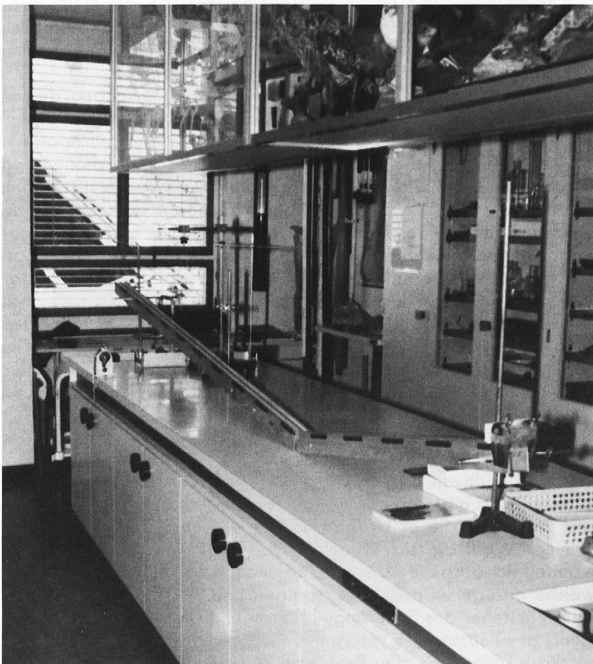
Blick in ein Schulzimmer im Jahre 1988.