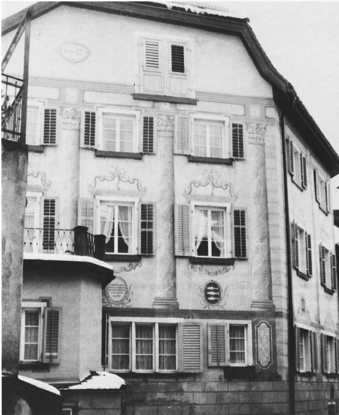
Das «Schulhöfli» in der Süsswinkelgasse, Chur. Erstmals 1582 erwähnt, gilt als ältestes Churer Schulhaus.

Grossen Einfluss auf die Entstehung einer eigentlichen Volksschule in Graubünden übten schliesslich die um die Mitte des 18. Jahrhunderts gegründeten und dem Geist der Aufklärung verpflichteten Erziehungsinstitute aus.