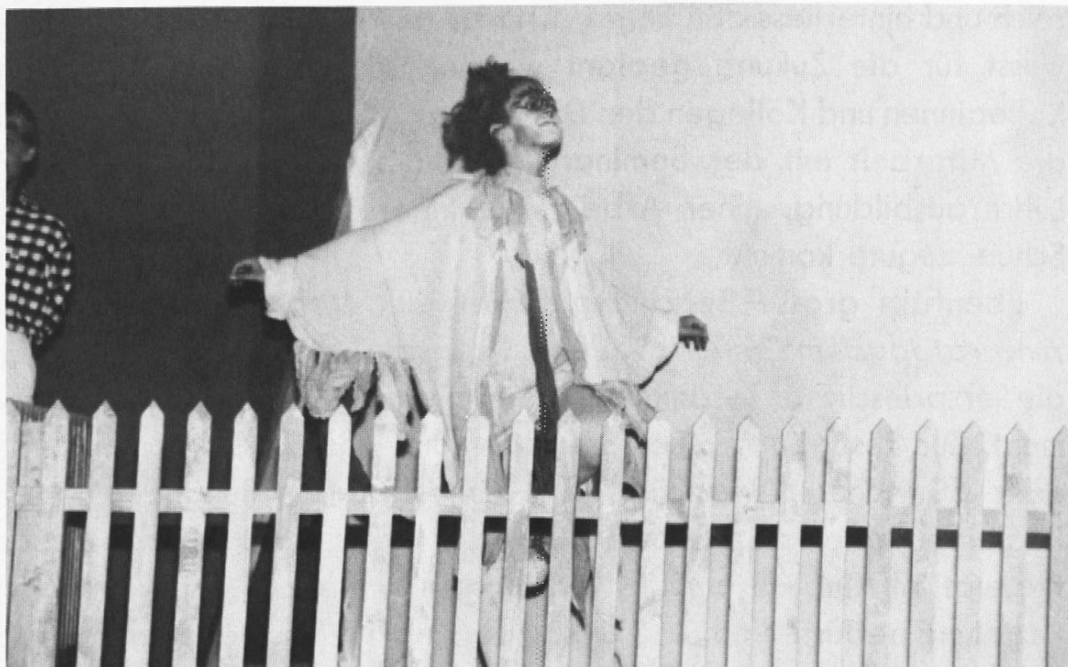
Abendunterhaltung: Kinder spielen die «Bremer Stadtmusikanten.»

die Bündner Volksschule herantreten. Wir zweifeln nicht daran, dass ihm dank seines Verhandlungsgeschickes und seiner Tatkraft gelingen werde, diese schwierigen Aufgaben zu einem guten Ende zu führen. – Die Lehrerschaft darf auf alle Fälle mit der Unterstützung eines verständnisvollen Erziehungschefs rechnen. An unserer Unterstützung und loyalen Zusammenarbeit darf es nicht fehlen.