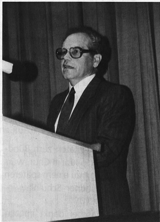
Regierungsrat Joachim Caluori

Die mit Spannung erwartete Regelung der Pflichtlektionen der Lehrer würde nicht wie vorgesehen anfangs 1990 in die Vernehmlassung gehen, sondern verschoben, da auch die Frage des Bildungsurlaubes für Lehrer zu regeln sei. In diesem Herbst würden die Erziehungsdirektoren der EDK-Ost über das Projekt Intensivfortbildung befinden. Auch in Graubünden dränge sich die Regelung dieser Art der Lehrerfortbildung auf, und eine Revision der Lehrerbeförderungsvorschriften sei notwendig. Die Lehrerorganisatio-