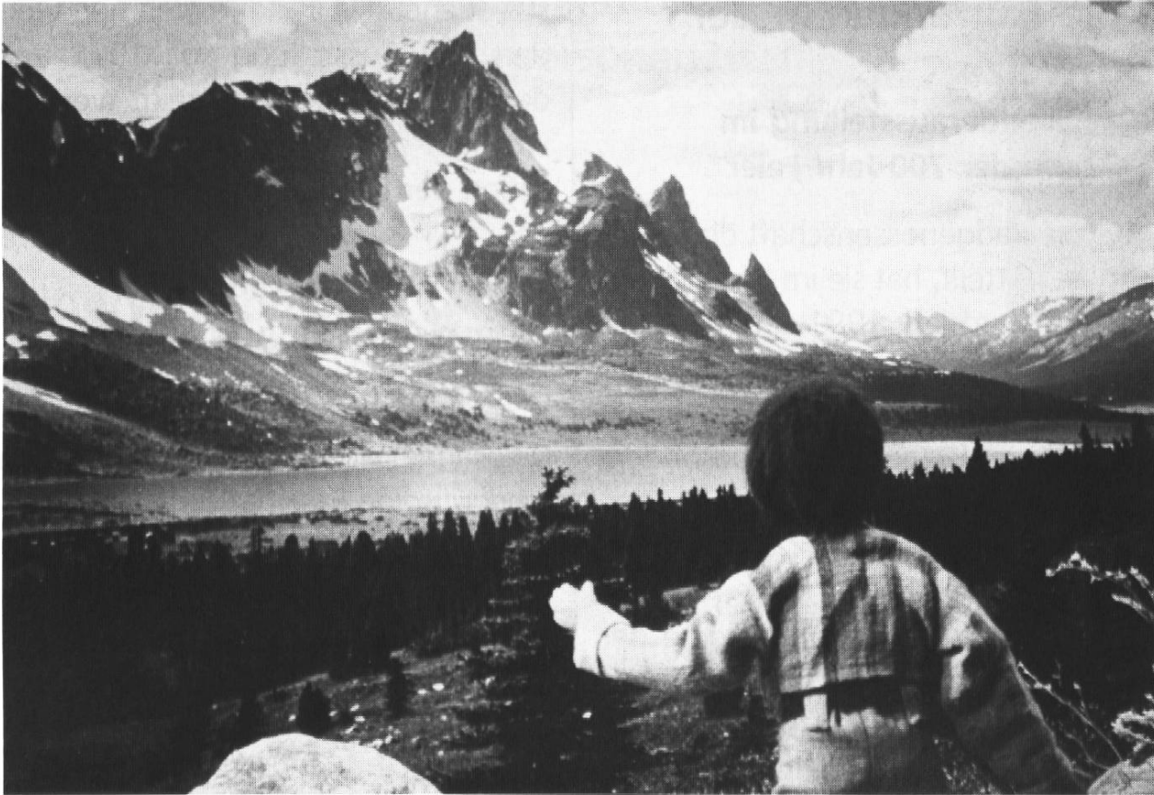
Jerry auf der Suche nach dem heiligen Baum.

heiligen Baum – du wirst ihn bestimmt finden.» Der Junge begibt sich auf den Weg. Wir erfahren, welchen Abenteuern er unterwegs begegnet, und wie er neuen Lebensmut findet. – Das neue Video oder Tonbild kann im Zusammenhang mit vielen Unterrichtsthemen sinnvoll eingesetzt werden, und es bietet zahlreiche Impulse für Gruppen- und Klassengespräche mit Kindern ab 8 Jahren und mit Erwachsenen: z. B. Indianer heute; Alkoholismus in der Familie; Werte und Normen; das Baumsymbol; bedeutungsvolle Träume; Suche nach dem Lebenssinn; auf dem Weg zum Erwachsenwerden, zur eigenen Identität.