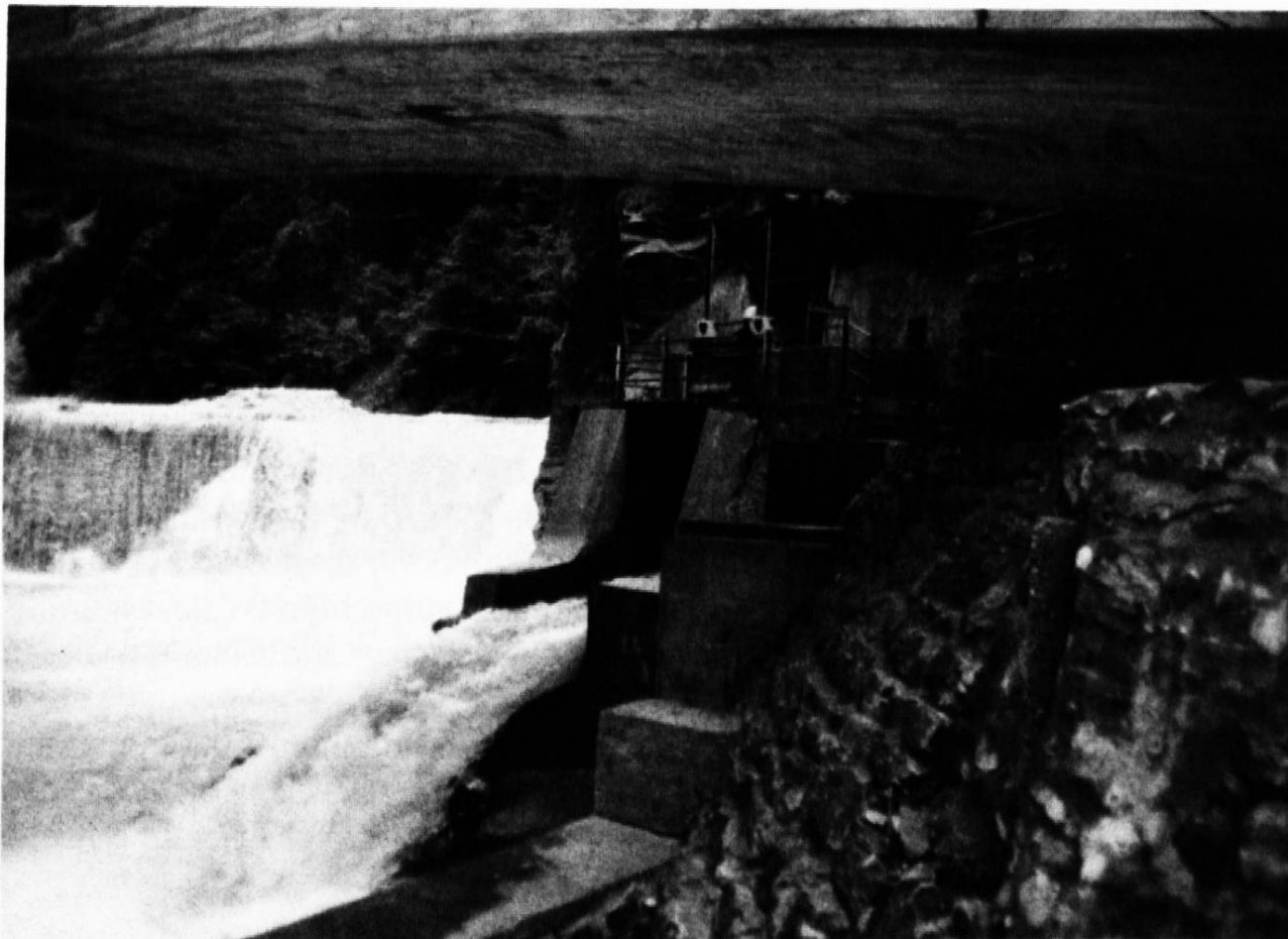
Die Wasserfassung für den Igiser Mühlbach in der Klus.

Auf seinen 6 km Länge verliert er 49 m Höhe. Zuerst fliesst er Richtung Schloss Marschlins und wendet sich danach dem Rhein zu. Seit dem 16. Jahrhundert werden Mühlen regelmässig in den Schriften erwähnt. An der Landquart standen ebenfalls Mühlen. Die Wasserkraft trieb auch andere Maschinen an. In den verschiedenen Schriften werden Sägereien, Stampfen, Hanfreiben und auch Schmieden erwähnt.