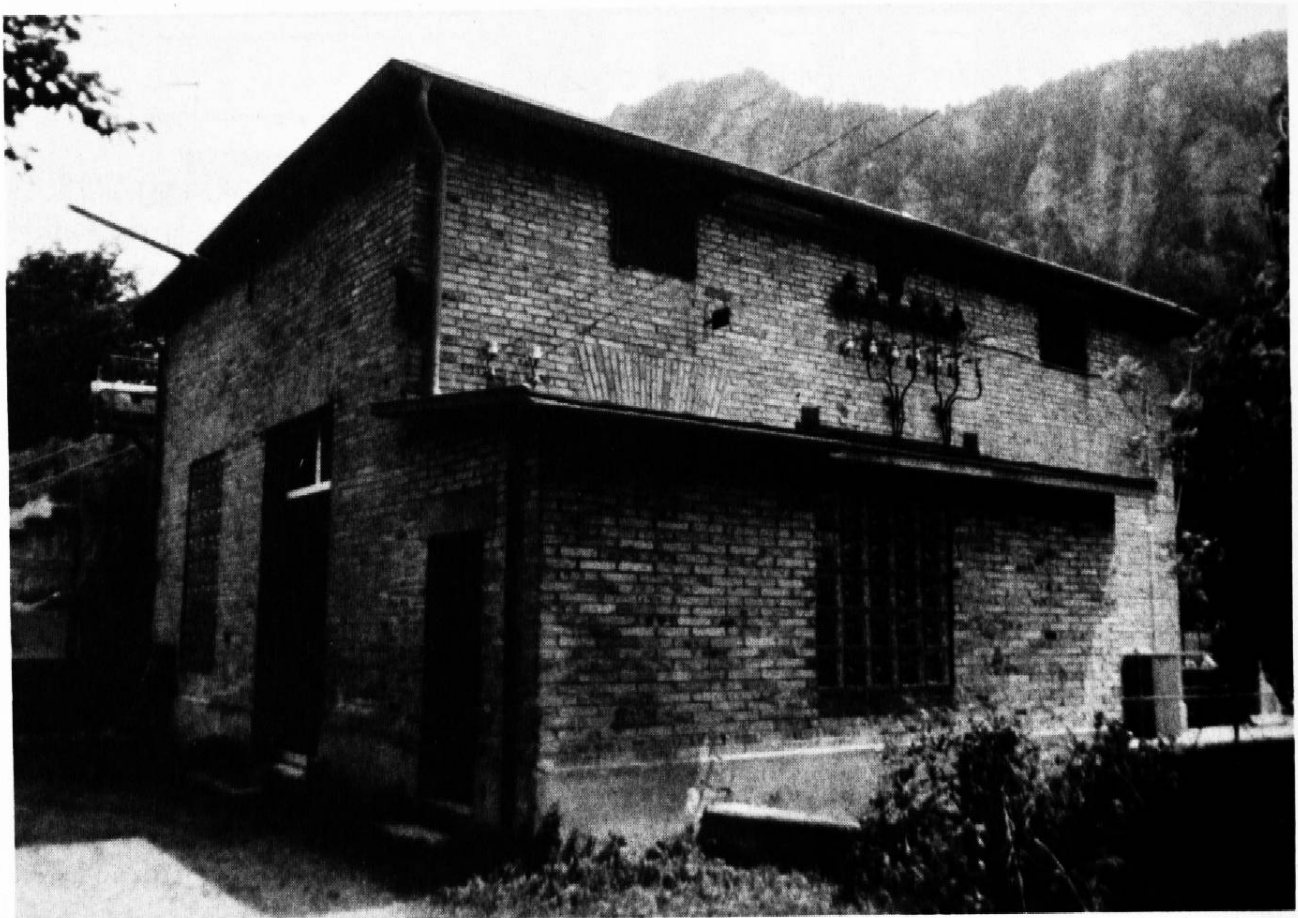
Ein Kraftwerk am Mühlbach. Insgesamt werden am Igiser Mühlbach heute noch in 3 Staustufen ca. 860 kW elektrischer Strom hergestellt.

Schon früh stritt man sich um Restwassermengen. In einem Abkommen aus dem Jahre 1872 wurde das Quantum Wasser festgesetzt, welche die jeweiligen Benutzer aus der Landquart entnehmen durften. Der Mühlbach beispielsweise wurde auch zum Bewässern der Wiesen benötigt.