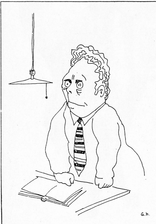
Katechetentyp 2: Der «So-jetzt-wollen-wir-mal»-Katechet

Für die Unterrichtenden bedeutet es immer wieder eine grosse Herausforderung, den Platz für den Unterricht in einem Umfeld zu sichern, das häufig wenig Verständnis zu haben scheint. Umso erfreulicher ist es zu sehen, mit wieviel Engagement und Können an vielen Orten dieser Unterricht erteilt wird.