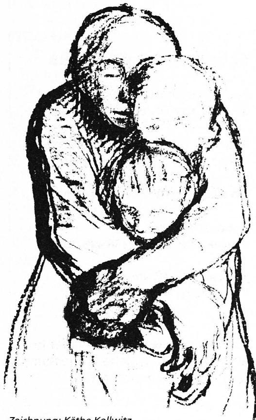
Zeichnung: Käthe Kollwitz