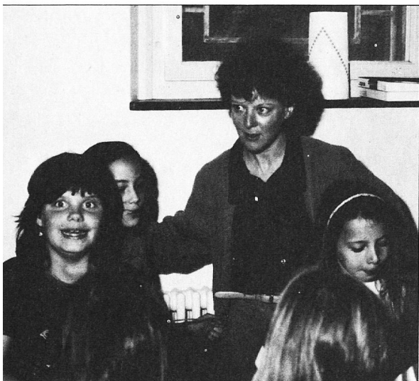
Die Museumspädagogin an der Arbeit

Infolge Renovierung war das Kunsthaus drei Jahre lang geschlossen (1987-1990). Bei der Neueröffnung hat natürlich das Haus mehr interessiert als die