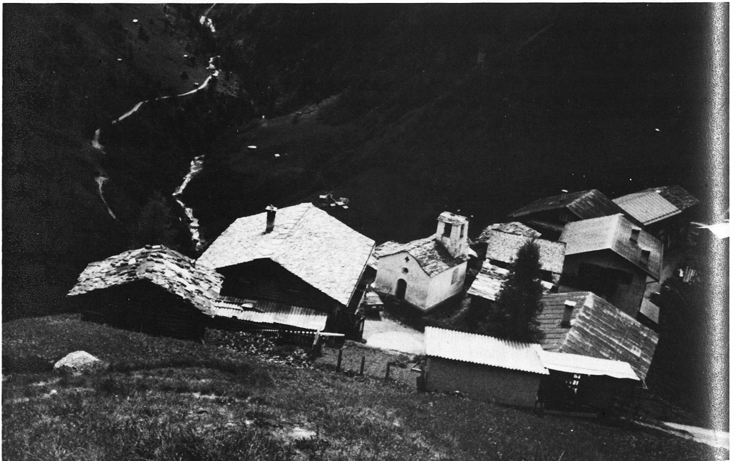
Auf den Spuren der Walser – unsere erste Leserreise

Am Samstag, den 20. Juni, treffen sich die Teilnehmer,-innen um 13.30 Uhr in Ilanz. Mit dem Postauto fahren wir nach St. Mar-