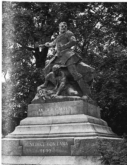
Benedikt Fontana, der die Leute des Gotteshausbundes anführte.

Raiffeisenbank Zizers Postcheckkonto 70-165-7 Lehrerkollegium der Rudolf Steiner Schule Chur, Konto Nr. 641 105