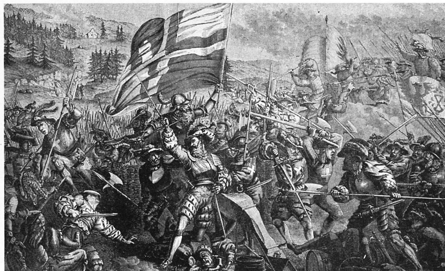
So stellte man sich im 19. Jahrhundert die Calvenschlacht vor.