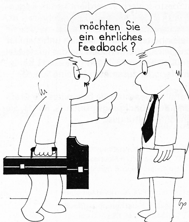
Absolute Ehrlichkeit verbessert das Klima...