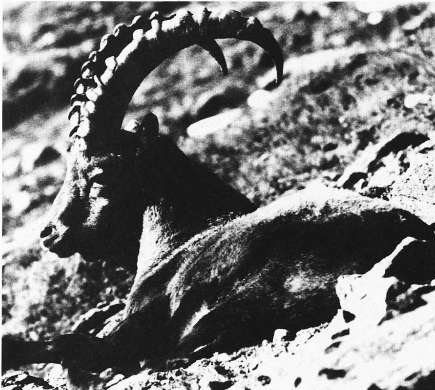
«Jubiläums- und Wappentier»

Öffnungszeiten: Dienstag bis Samstag, 10.00 bis 12.00 und 13.30 bis 17.00 Uhr, Sonntag, 10.00 bis 17.00 Uhr durchgehend, Montag geschlossen.