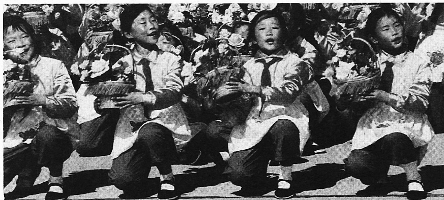
Mit Kindern aus andern Ländern aktiv kommunizieren

Zur Teilnahme am Kulturlager sind Schulklassen der Sekundarstufe I (Oberstufenklassen) aller Kantone eingeladen. Voraussetzung ist das Interesse an Kultur, Globalem Lernen, internationaler Kommunikation und Kinderrechten. Ein entsprechendes Auswahlverfahren soll gewährleisten, dass die Klassen aus möglichst vielen verschiedenen Kantonen stammen. Pro Lagerwoche kann je eine Klasse pro Sprachregion (d.h. insgesamt vier) mit je