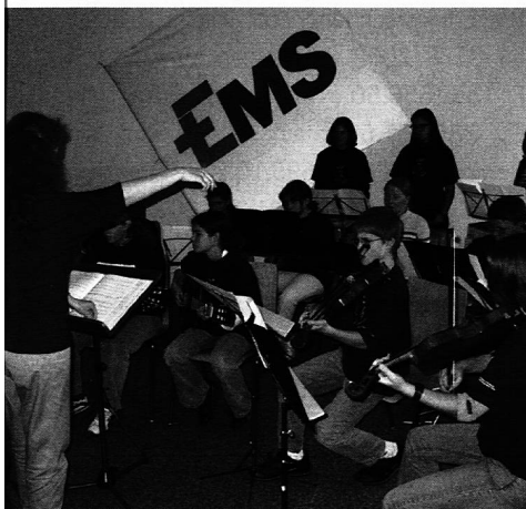
Jugendorchester Domat/Ems und Umgebung