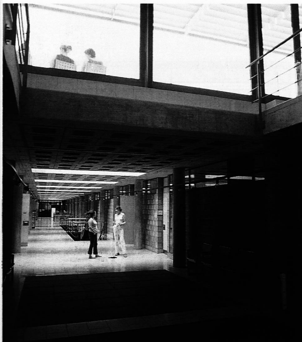
Die PFH GR im Kantengut am Stadtrand von Chur vereint alle Abteilungen unter einem gemeinsamen Dach.

Der Homepage des LGR wurde ein Forum beigefügt, welches den Lehrpersonen den direkten Zugang zur Publikation von persönlichen Meinungsäusserungen ermöglicht. Die Homepage der Kindergärtnerinnen erhielt ein Facelifting und diejenige des VBHHL wurde neu aufgebaut und unter dem «Dach» der LGR Homepage platziert.