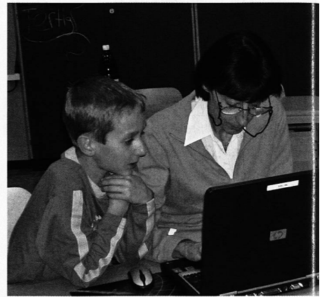
Nein, meine Hände darf ich nicht brauchen beim Erklären.

CompiSternli Marino (4. Klasse) meint: «Ich finde den Computerkurs sehr spannend. Aber es ist nicht leicht, da man viel Nerven braucht. Sonst wäre es nicht so schwierig. Mir persönlich gefällt es sehr