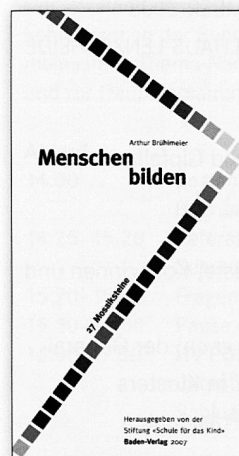
Arthur Brühlmeier: Menschen bilden, Baden-Verlag 2007

Das Gute an Brühlmeiers Buch ist, dass man es aus verschiedenen Perspektiven lesen kann: Einmal als zeitgenössische Einführung in Pestalozzis Pädagogik, dann als Ideen- und Reflexionsquelle für LehrerInnen sowie zu guter Letzt als Orientierungshilfe für Erziehende in der anspruchsvollen Bildungsarbeit.