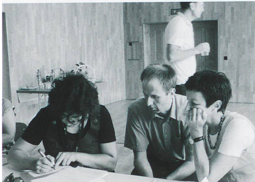
Inspektorinnen und Inspektoren entwickeln ein analoges Evaluationsverfahren für den Sonderschulbereich