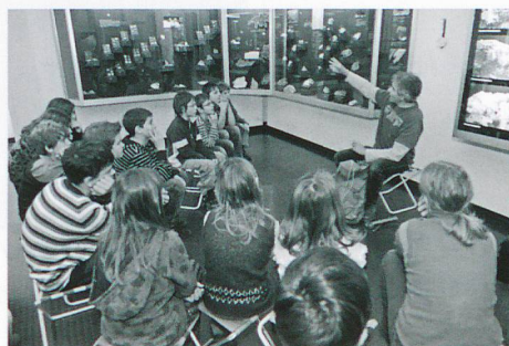
Eine Schulklasse erhält durch den Museumspädagogen einen Einblick in die Mineralienausstellung.

chenbaren Kosten bzw. mit einem Maximalbetrag von Fr. 1500.– pro Schuljahr. Eine Zusammenarbeit mit Kulturschaffenden oder kulturellen Einrichtungen ist erwünscht. Unterstützt werden auch nicht öffentliche kulturelle Veranstaltungen im Kindergarten bzw. Schulhaus. Folgende Unterlagen sind bei einer Projekteingabe einzureichen: Angaben zu Gesuchstellenden, Projektbeschreibung (max. 5 A4-Seiten), Terminplan, Budget, Finanzierungsplan. Die Gesuche sind mindestens zwei Monate vor Projektbeginn an folgende Adresse zu richten: Kulturförderung Graubünden, Loestrasse 26, 7000 Chur. Die Bearbeitungszeit dauert zwei bis drei Wochen.