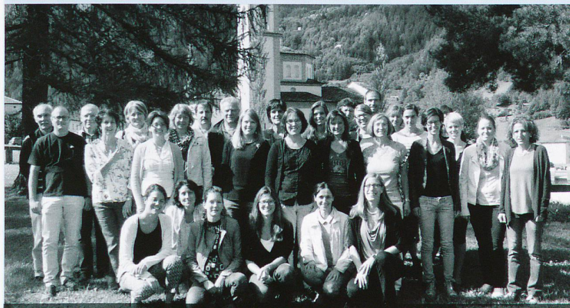
Scuola dell'infanzia, pedagogisti specializzati, scuola elementari, logopedia