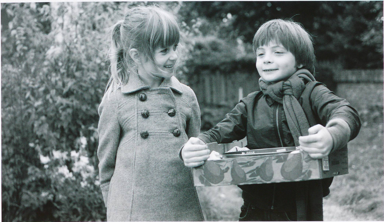
Bild aus dem Film «Der kleine Zappelphilipp» – Meine Welt ist bunt und dreht sich (Brammetje Baas, 2012): Niederländischer Familienfilm über einen etwas zu aufgeweckten kleinen Jungen.

VON DR. ANDREAS MÜLLER, CEO GEHIRN- UND TRAUMASTIFTUNG