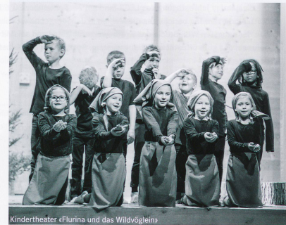
Kindertheater «Flurina und das Wildvögeln»

In der 5. und 6. Klasse nehmen alle Schülerinnen und Schüler am Zukunftstag teil. In der 2. Klasse der Sekundarstufe Arosa findet eine Lektion Berufswahl statt. Die Schnupperlehren finden – sofern möglich – während der Schulferien statt. Besichtigungen werden in einigen Betrieben von Arosa angeboten. Andere Berufsleute kommen direkt in die Schule und versuchen mit einer Präsentation die Schülerinnen und Schüler für eine Berufslehre zu gewinnen. Die Fiutscher-Ausstellung in Chur bietet einen weiteren Meilenstein auf dem Weg der Berufsfindung. Zudem kommt die Berufsberaterin jeden Herbst nach Arosa und referiert an einem Elternabend über die Begleitung der Jugendlichen bei der Berufswahl. Die 2. Klasse holt weitere Informationen anlässlich eines Besuches im Berufsinformationszentrum (BIZ) ein.