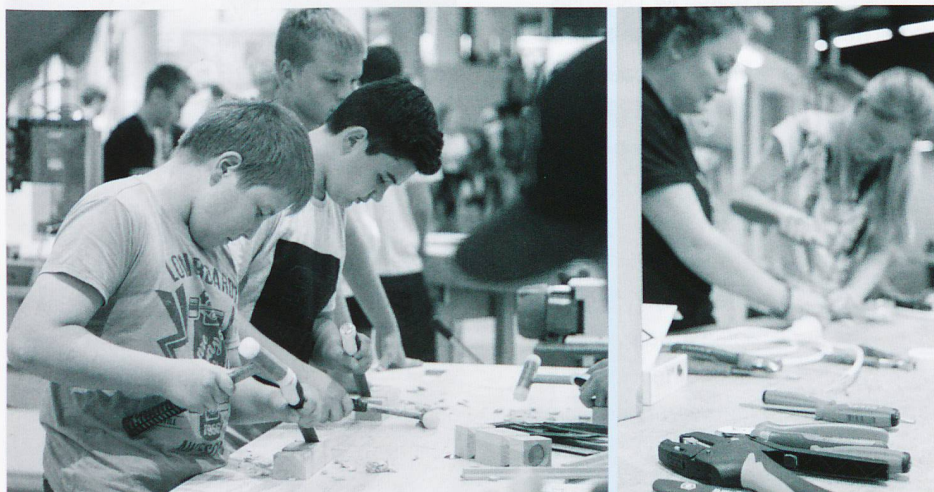
Anmeldung für Schulklassen: www.oba-sg.ch/lehrpersonen

Nebst umfangreichem Informationsmaterial profitieren Besucherinnen und Besucher vor allem vom direkten Gespräch mit den Profis. Mit Auszubildenden oder Berufsexperten aus verschiedensten Fachrichtungen Fragen, Erfahrungen und Wissen auszutauschen – das gibt's nur an der OBA. Für Unentschlossene lohnt sich ein Besuch besonders: Viele Berufe lassen sich gleich ausprobieren und erleben. Die OBA bietet viele weitere (kostenlose) Highlights: Karriereberatung, Berufswahlanalyse, professionelle Bewerbungsfotos, Probe-Bewerbungsgespräche und vieles mehr. Alle Infos unter www.oba-sg.ch .