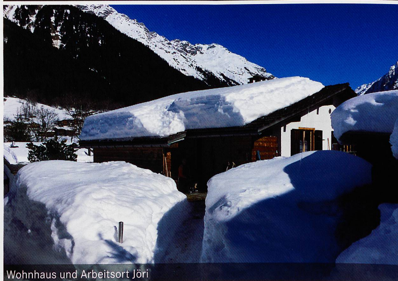
Wohnhaus und Arbeitsort Jöri

ner Bildungstag mit zu organisieren. Trotzdem ist er froh, dass dieser nicht jedes Jahr stattfindet, denn dazu würden ihm wohl die Kraft und Energie fehlen.