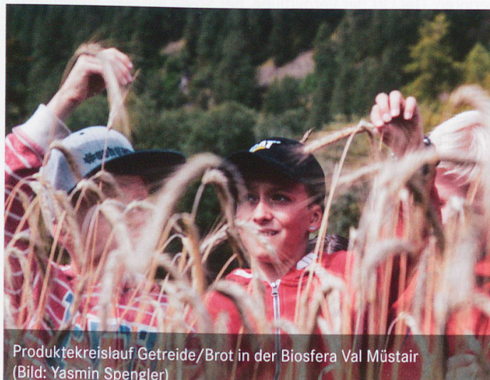
Produktkreislauf Getreide/Brot in der Biosfera Val Müstair