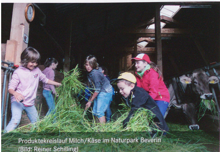
Produktkreislauf Milch/Käse im Naturpark Beverin

Tel. 058 934 56 65 (Geschäftsstelle Verein Bündner Pärke)