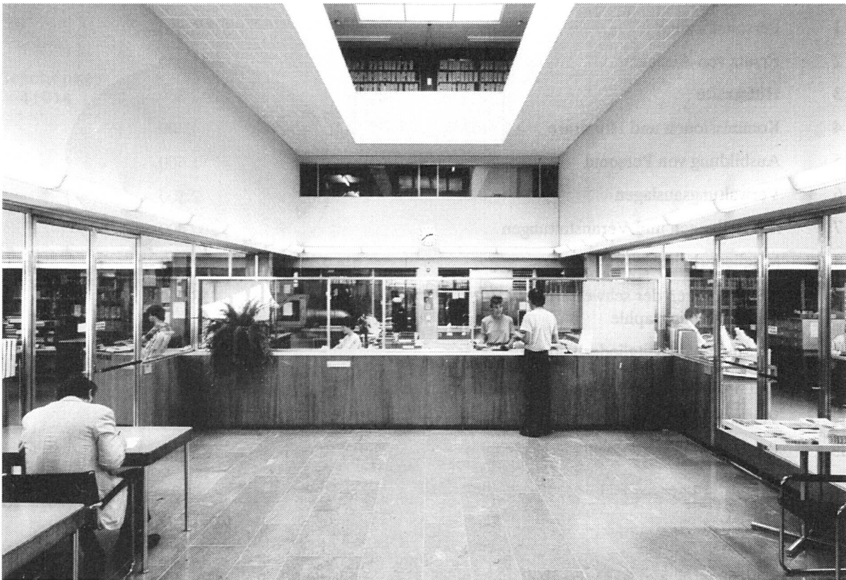
Ausleihe mit Eingängen zum Lesesaal und Katalogsaal