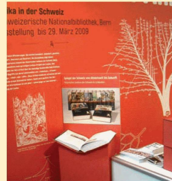
Die NB an der Buch.08