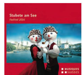
Stubete am See