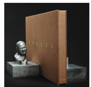
Urs Lüthi, Bücherstütze, 2011