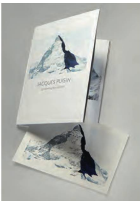
Pugin, Jacques, La montagne s'ombre , 2018