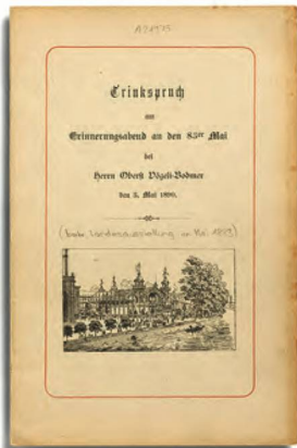
Hardmeyer, Jakob, Trinkspruch , 1890