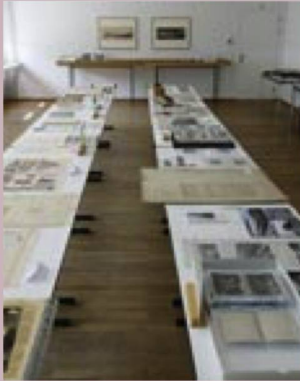
Blick in die Ausstellung anlässlich der Europäischen Tage des Denkmals