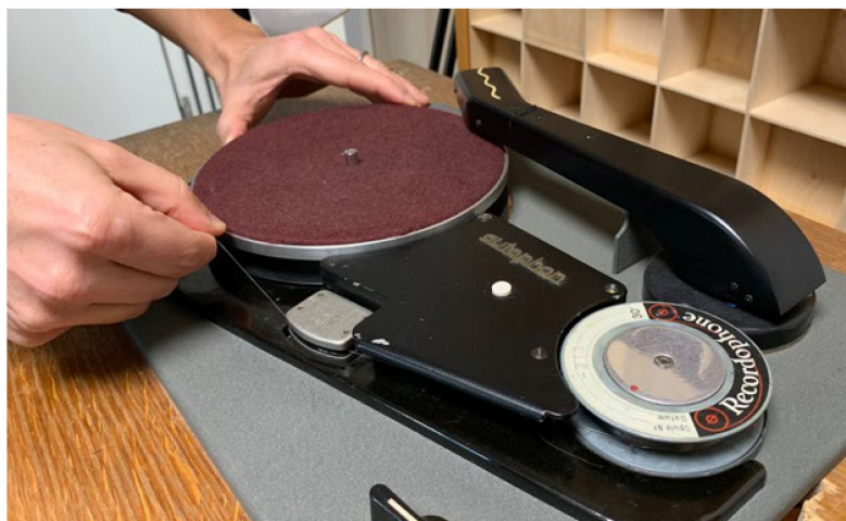
Die Klangmaschine des Monats

Interview mit der Tessiner Schriftstellerin