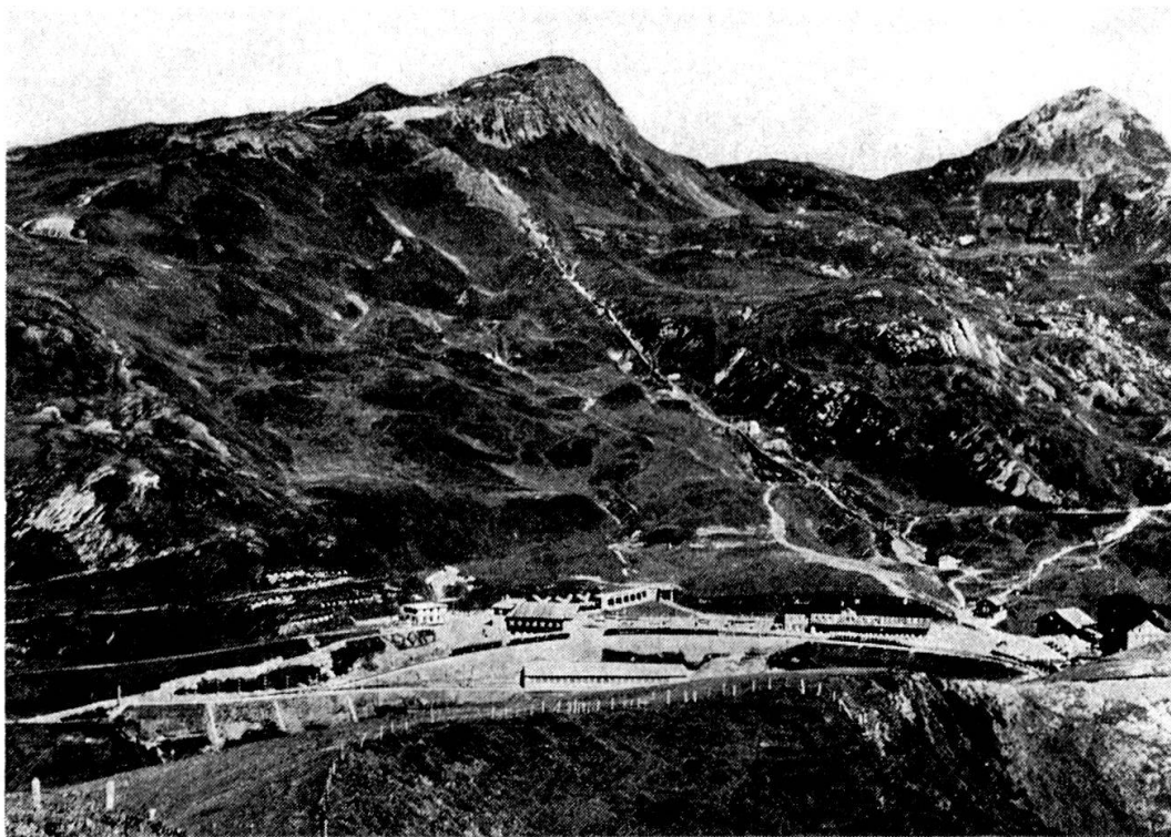
Kleine Scheidegg-Lauberhorn; rechts der Tschuggengipfel. Zerfallende Berge! Hinter (N) dem Skilift Versackung in größeren Komplexen, links davon (S) viel kleinere Schollen, alles Eisensandstein.

Über der Waldgrenze fallen im Raume Tschuggen-Lauberhorn-Wengernalp-Fallboden-Bustiglen-Sattelegg vielerorts Auflösungsformen auf: unruhige Bodenfläche, ausgeprägte Kleinformen und Blockschutt. Die wenigen Felswände zeigen starke Klüftung, Verstellungen und Zerfall. Daß östlich des Hauptgrates nicht ebenfalls Bergstürze vorherrschen, liegt in den viel weniger steilen Hängen begründet. Das große Gebiet des Itramen-, Brands- und Hubelwaldes ist, vor allem