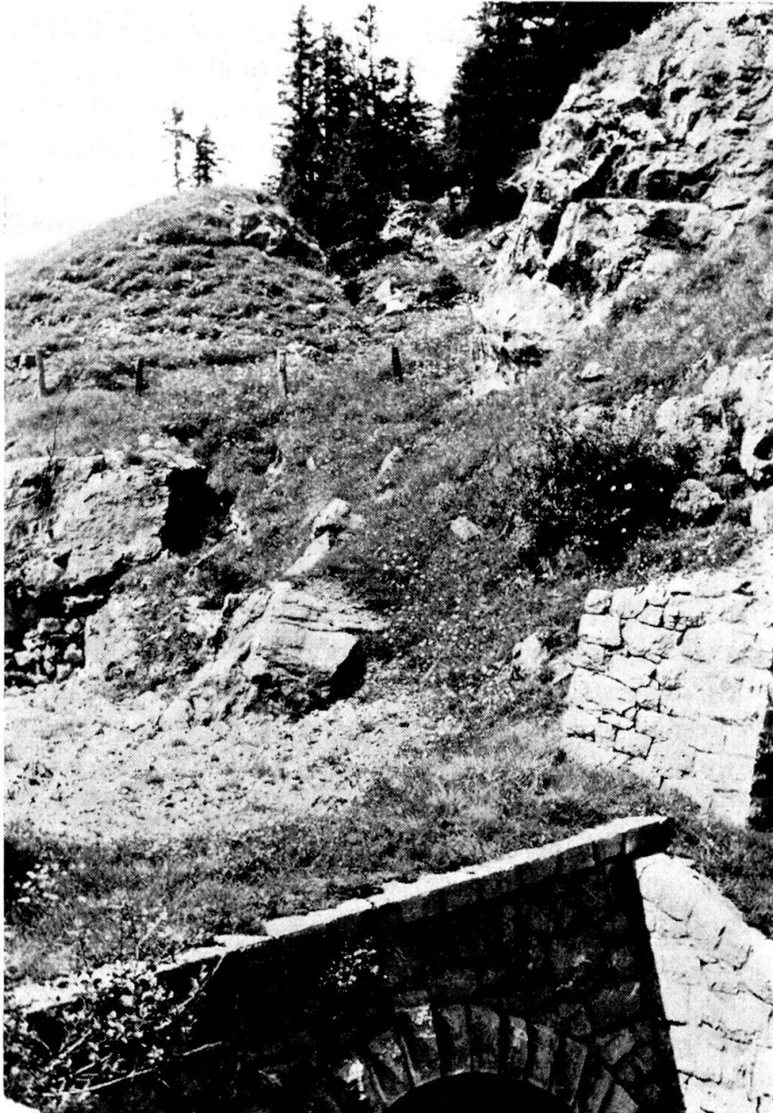
Südlicher Tunnelausgang W Bigelti. Darüber ein in Entwicklung begriffener Sackungsgraben.

Die Hauptmasse umfaßt in ihrer heutigen Ausdehnung unterhalb 850 m 0,55 km 2 , erreicht eine maximale Tiefe von 50–60 m und zeigt im unteren Teil des Rufigrabens eine Böschung von 13°, also weit unter jeder normalen Schuttböschung. Da es sich keinesfalls um einen Schwemmkegel handelt, muß die ganze Masse oder doch ein Großteil davon durch einen Bergsturz an den heutigen Standort gelangt sein.