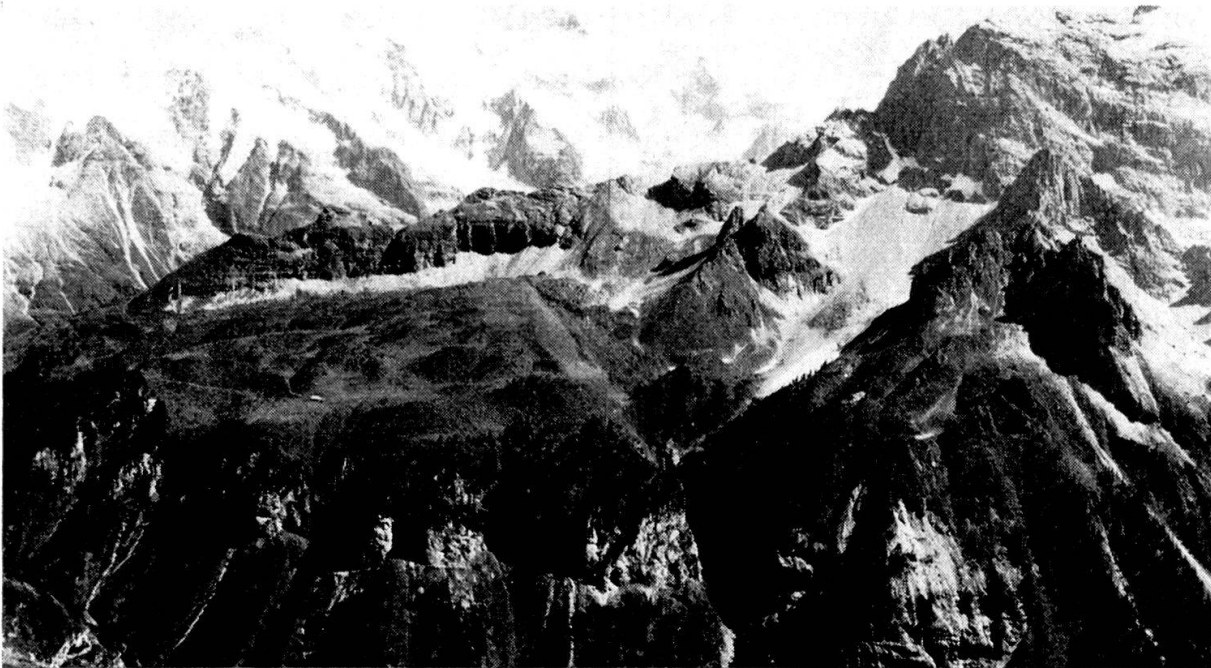
Blick von der Wasenegg auf den Grat Ellstabhorn (rechts) bis Spitzhorn. Davor rechts das Ghudelhorn, in der Mitte Pt. 2226 und links die Busenalp. Darunter die stark zerrütteten Felswände mit mächtigen Blockschuttmassen, die bis ins wesentlich tiefer liegende Sefinental hinunterreichen. Gut erkennbar die trennende Kerbe zwischen Busenalp- und Ghudelhornkomplex.

obere Alp liegenbleibt. Tiefe und wirkliche Breite dieses Tälchens lassen sich wegen der Schuttfüllung nur abschätzen; die Breite schwankt zwischen 150 und 250 m.