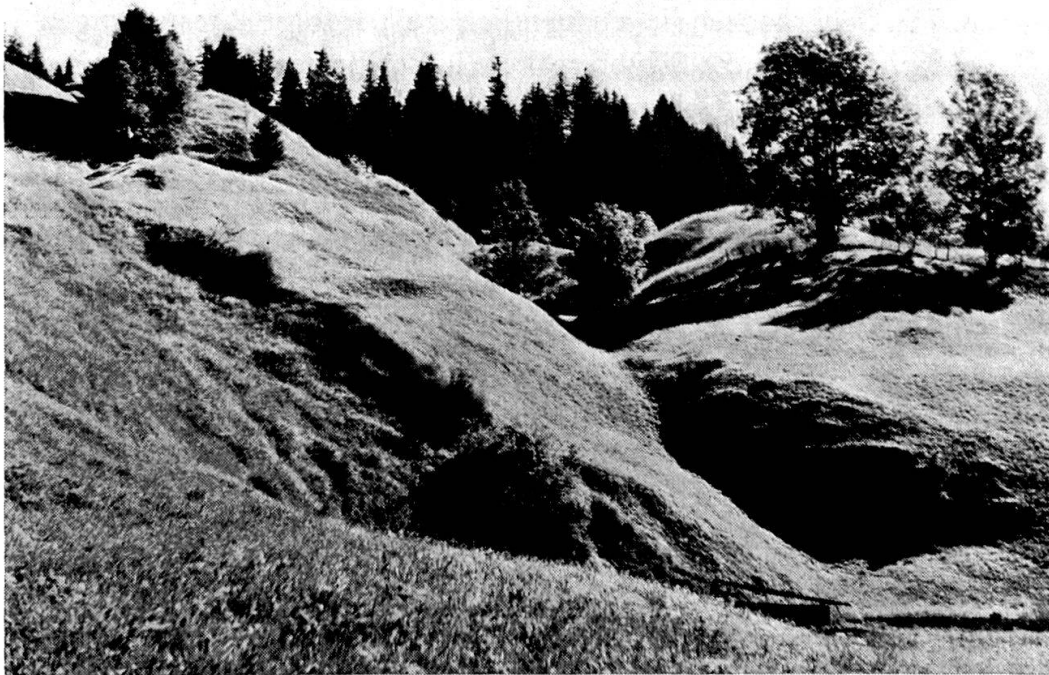
Verrutschte Aalénienschiefermassen bei Dürrlöcher, 1340 m N Grindelwald. Bei starker Durchnässung (Schneeschmelze) entstehen hier sehr oft kleine und kleinste sekundäre Rutschungen.

Geologisch bietet sich folgendes Bild: Zwischen der Großen Scheidegg und Grindelwald liegt ein großer Komplex von ca. 400 m mächtigen Aalénien-Ton-