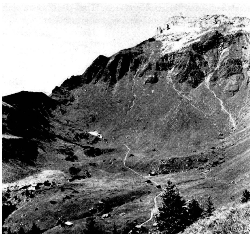
Birg-Mürrenberg vom Allmendhubel. Das helle Abrißgebiet ist deutlich, ebenso die kleinere, hintere Ablagerung. Die untere, größere Masse ist nur teilweise sichtbar. Sie setzt sich nach links unten fort.

Von Pt. 1852, der Pension Suppenalp, ostwärts bis auf die Höhe von 1750 m hinunter ist das Tal des Mürrenbachs auf seiner ganzen Breite durch Blockschuttmassen bedeckt, in die sich der Bach eingegraben hat. Das Gelände ist gewellt; aus