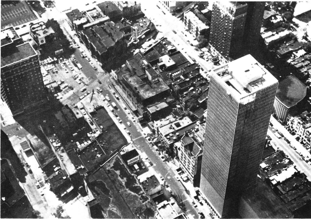
Abb. 2: Die sogenannt “moderne” Stadt als architektonischer und funktionaler Trümmerhaufen mit Wüstungserscheinungen, die in letzter Konsequenz nur noch vom ruhenden Verkehr genutzt werden können (Chicago: Stadtzentrum).