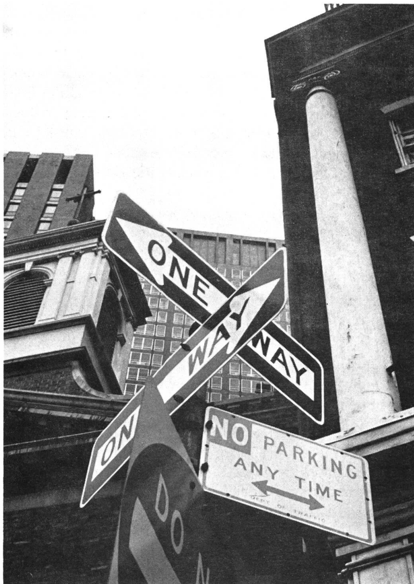
Abb. 3: Die absolute Freiheit im Städtebau muss durch eine Unzahl von Geboten und Verboten korrigiert und eingeschränkt werden (New York: Manhattan).

Ohne auf weitere Punkte des Strukturwandels, insbesondere im gesellschaftlichen, wirtschaftlichen und technischen Bereich einzutreten, mögen diese vier Ideen zeigen, dass die natürlichen Elemente Vegetation, Boden, Luft und Wasser in der modernen Stadtregion verdrängt oder geschädigt wurden. Aber gerade dadurch wurde sich der Mensch ihrer Bedeutung zusehends bewusst. Sie können in künftigen Planungen nicht mehr übergangen werden und sie haben neue Funktionen zu übernehmen.