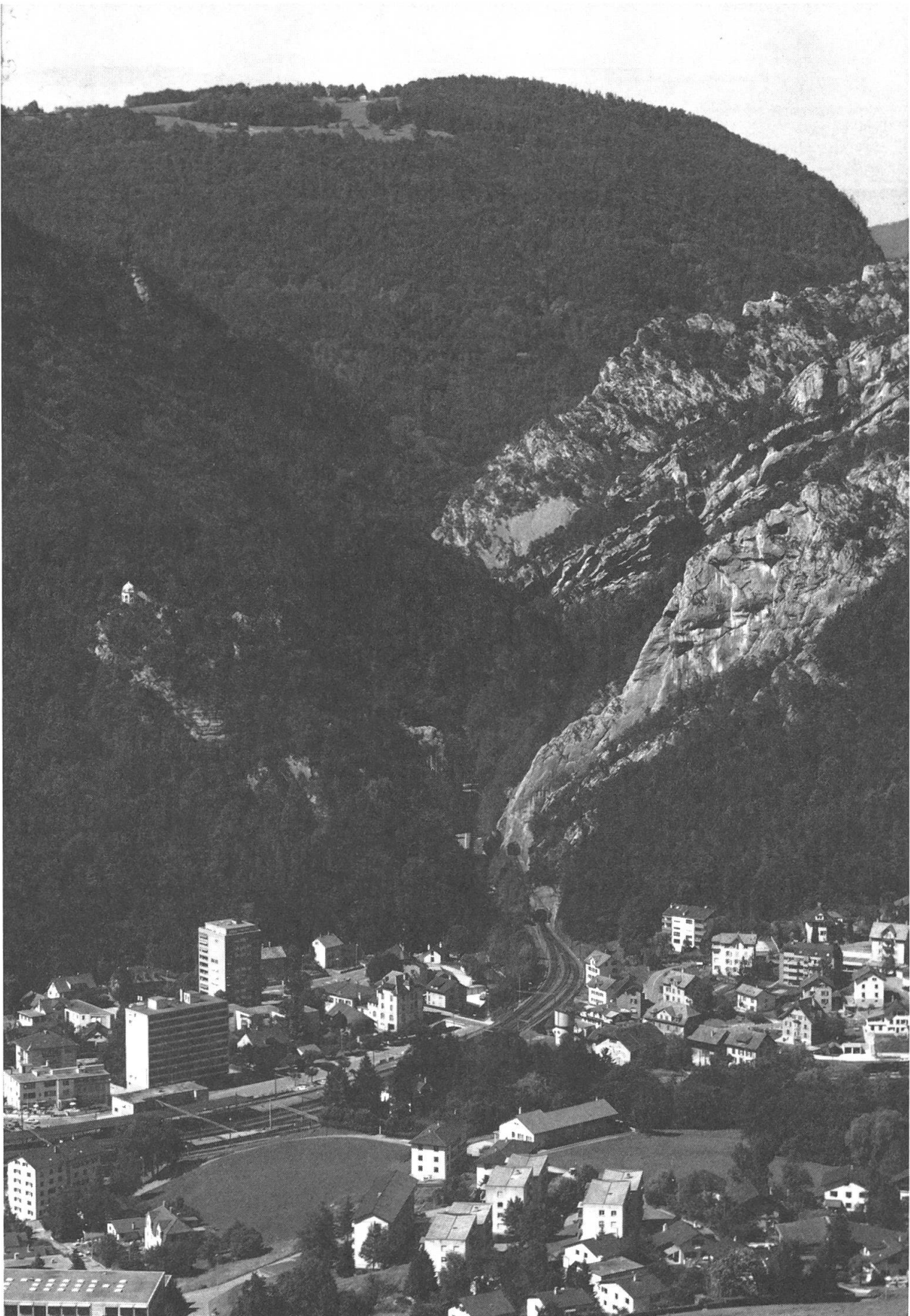
Photo 1: L'entrée méridionale de la cluse de Moutier