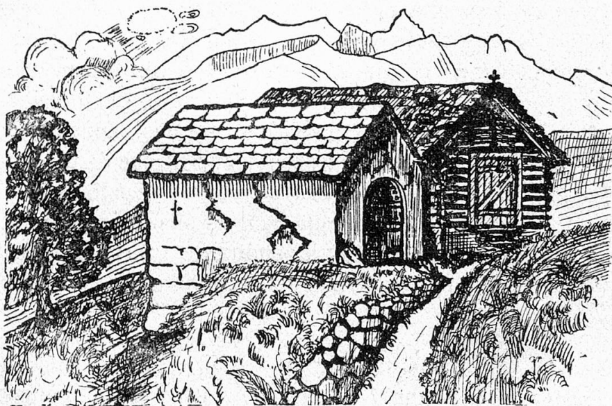
Caplutta veglia de Cumbel

glisch.“ Cun tala roda de 4 onns dueva quell'obligaziun ir vinavon. Gl'ei stau basegns de renovar la brev e fixar ils obligai aunc ina secunda gada tras scartira dils 30 de fenadur 1893.