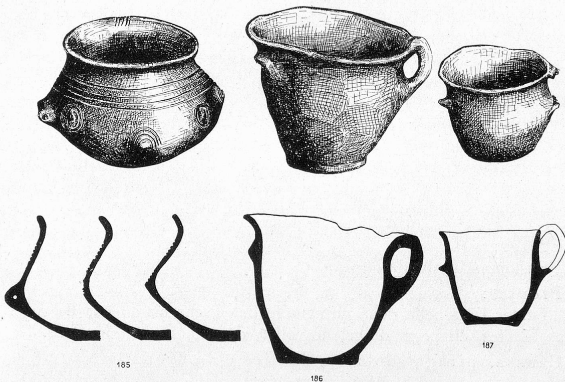
Ord «W. Burkart, Crestaulta, Monogr. z. Ur- und Frühgeschichte der Schweiz 5»

Mirs de fundament dellas habitaziuns cun pliras fueinas ed in fuorn de berschar vischala de tiara cotga.