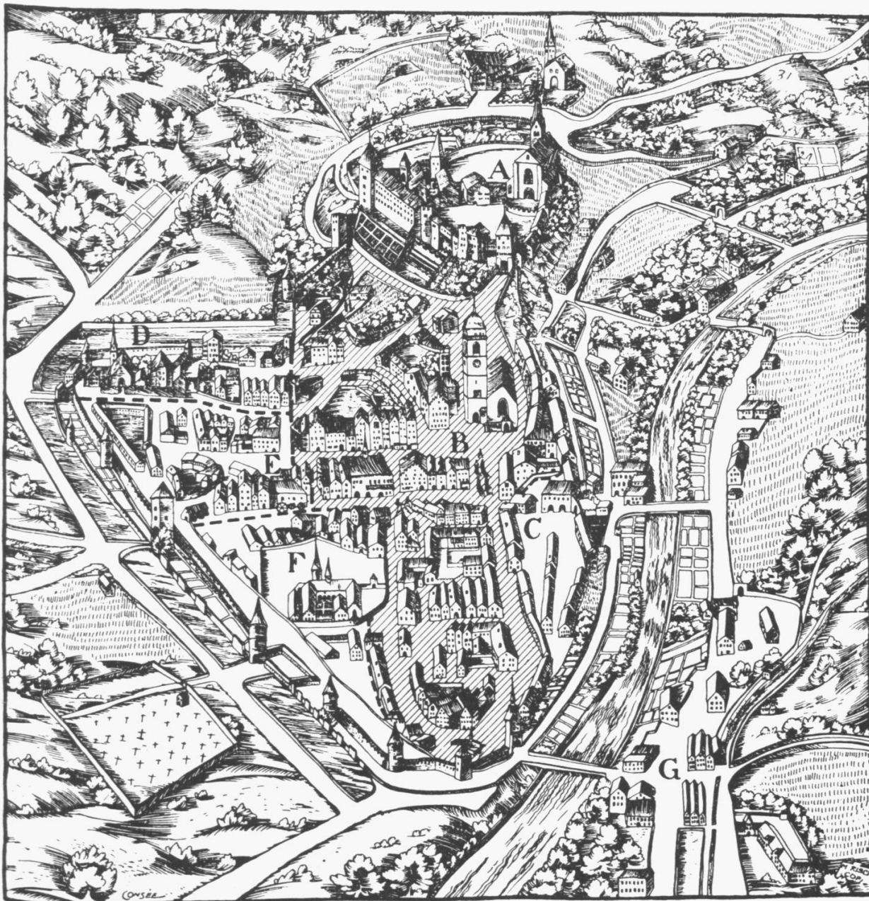
Abb. 1 Prospekt von Chur um 1640. Umzeichnung von M. Risch nach einem Ölgemälde aus dem Schloss Knillenburg bei Meran, im Rät. Museum. A Der Hof, B (schraffiert) Der «burgus superior», C Das Quartier Archas, D Salas, E Clawuz, F St. Nikolai, G Welschdörfli.