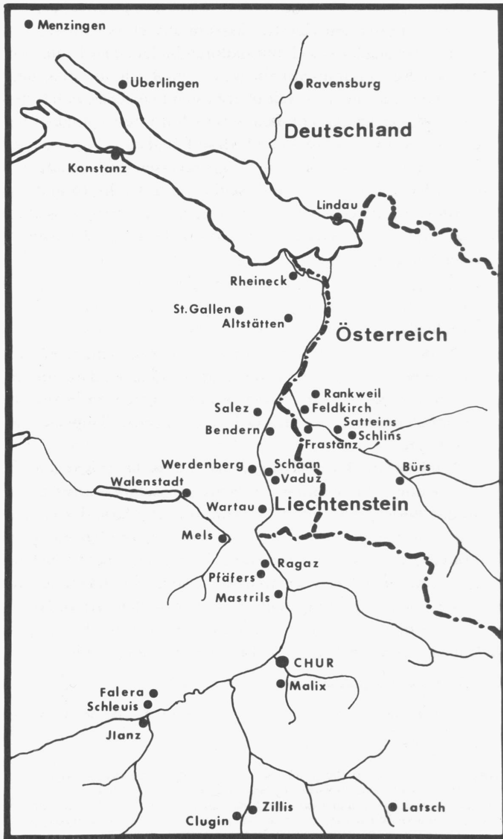
Abb.2 Einwanderung nach Chur um 1400.