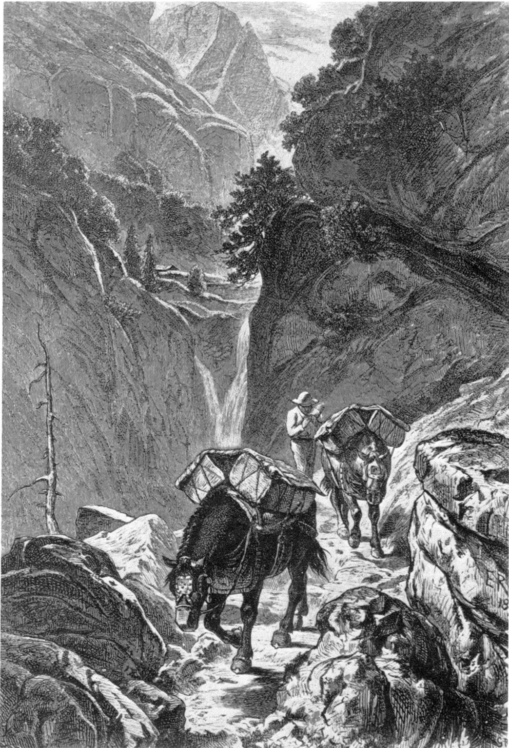
Abb. 1 Die beschränkten Möglichkeiten eines Warentransportes auf dem Rücken von Pferden zeigt diese Xylographie von Gustave Roux: «Saumpferde in der Bergschlucht». Rätisches Museum H 1962.229