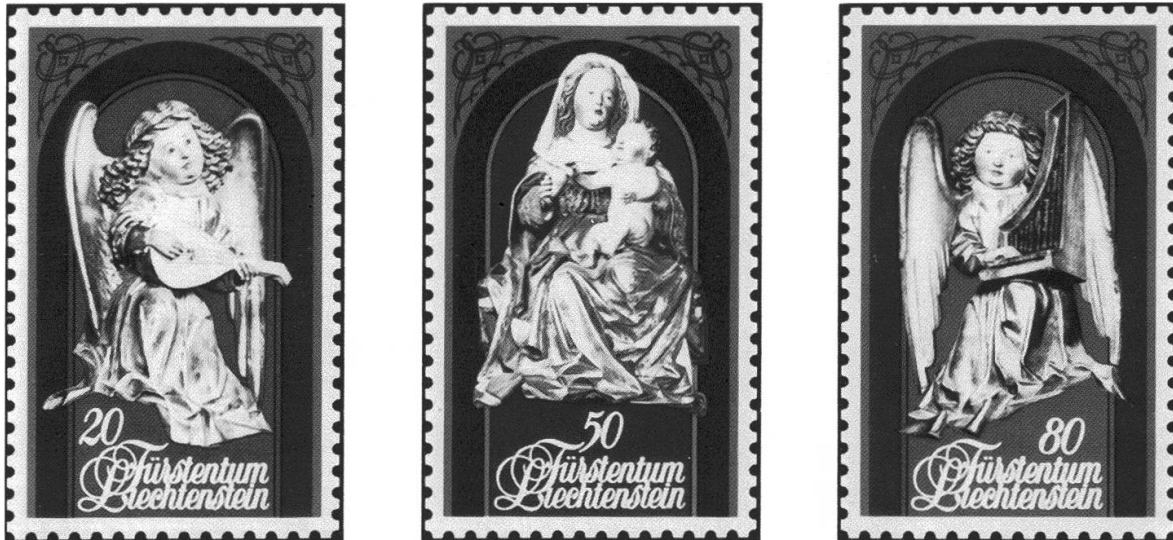
6 Weihnachtsmarken 1982, Detailbildnisse aus dem spätgotischen Hochaltar von Jakob Russ, Kathedrale Chur. Inv. Nr. H 1982, 431a–b.

stätigung «Gefunden von Pauli René Baretti auf Plaun digls mats, Scheid, Domleschg» sowie die Unterschrift des italienischen Co-Piloten Donadelli auf.