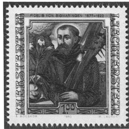
5 Sonderbriefmarken «Berühmte Gäste in Liechtenstein», Persönlichkeiten aus der Bündner Geschichte. Inv. Nr. H 1982, 430a–b.

sche Veranstaltung, lediglich auf private Initiative hin, wurde bei diesen Alpenüberquerungen Post in für diesen Zweck speziell entwickelten Postsäcken abgeworfen. Als solche Abwurfstellen sind in Graubünden Trimmis, Masans, Feldis und Scheid bisher bekannt. Bei einigen der eher kleinen Zahl von Luftpostbriefen und -karten, die auf diese Art befördert wurden, handelt es sich um Erinnerungsstücke, die von den Absendern an sich selbst adressiert wurden. Daneben sind aber auch reguläre Postsendungen von Absendern zu Empfängern festzustellen. In den meisten Fällen überstand das Postgut den Abwurf aus dem Flugzeug schadlos und wurde vom Finder der nächstliegenden Poststelle zur Beförderung an den Adressaten übergeben. Bei unserem Beleg handelt es sich um ein besonders schönes Objekt. Es ist eine schweizerische Bildpostkarte im Auslandstaxwert von 20 Rappen, die auf ihrer Vorderseite ein Bündner Motiv, eine Abbildung des Kirchleins von Sertig bei Davos, und mehrere Stempel zeigt, die den Postweg erläutern: Dornier-Flugzeugwerke Altenrhein, 2. Alpenüberflug von Altenrhein nach La Spezia mit dem Flugschiff «Do-X». Der Poststempel von Scheid bestätigt den Fundort des Postabwurfs und jener von Rorschach das Empfangspostamt. Die Rückseite weist die handschriftliche Fundbe-