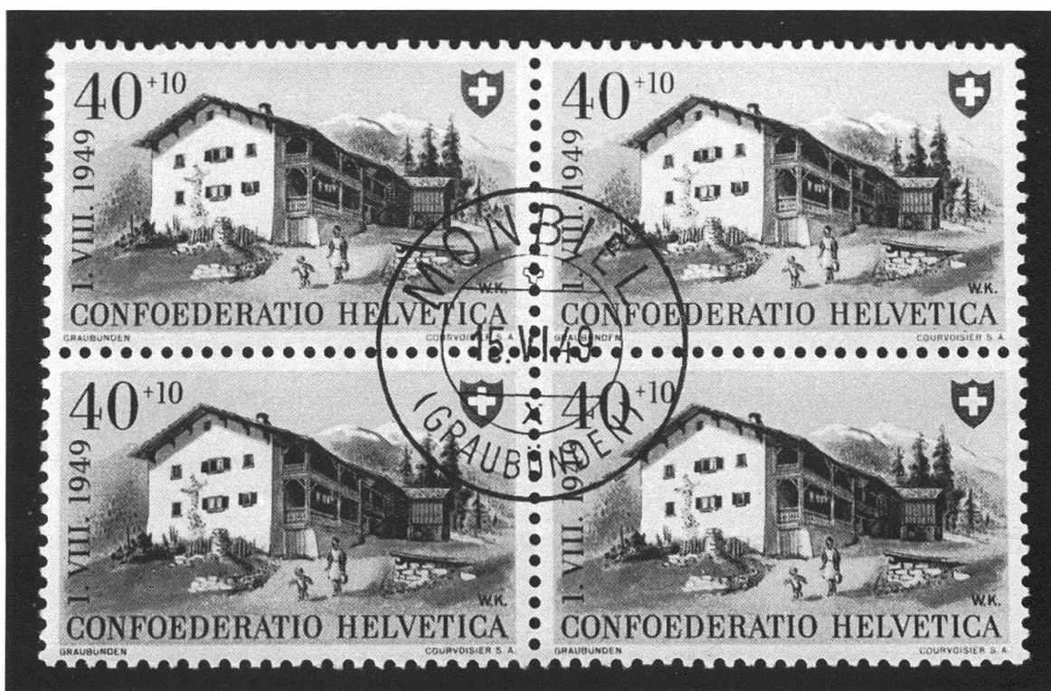
3 Haus Alte Post in Klosters-Monbiel auf Bundesfeierbriefmarke von 1949. Poststempel von Monbiel vom 15.6.1949 (Ausgabetag der Briefmarke). Inv. Nr. H 1982, 361.

Weisung des Postdepartementes vom 9.9.1850 an alle Kreispostdirektionen, ab 1. Oktober 1850 «die für die Ortsposten eingeführte Anwendung der Frankomarken auf alle auf dem Gebiet der Eidgenossenschaft zu frankirenden Correspondenzen auszudehnen», d.h. es soll die Beförderung der Briefpost im Inlande ausschliesslich mittels Frankierung durch Frankomarken stattfinden. Die Kreispostdirektion Chur befolgte diese Weisung mit einer postamtlichen Anzeige vom 19.9.1850, die in der Zeit zwischen dem 19.9. bis zum 30.9.1850 in Anbetracht ihrer Wichtigkeit und Tragweite des mit der Einführung der Briefmarken verbundenen absolut Neuen zu wiederholten Malen in der Bündner Presse erschienen ist.