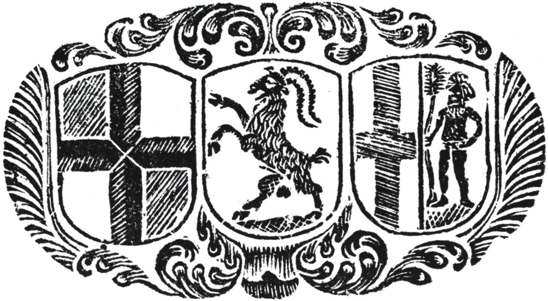
Wappen der Drei Bünde 1737. (Stadtarchiv Chur, STC 12:001)