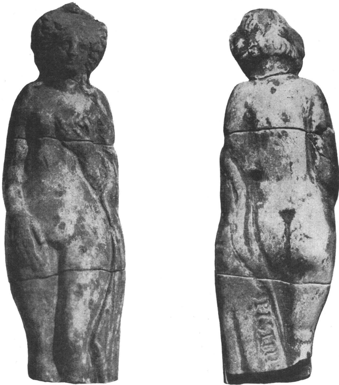
Die «Venus von Olten»