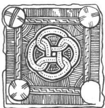
ZULLWIL BEZ: THIERSTEIN, SOLOTHURN